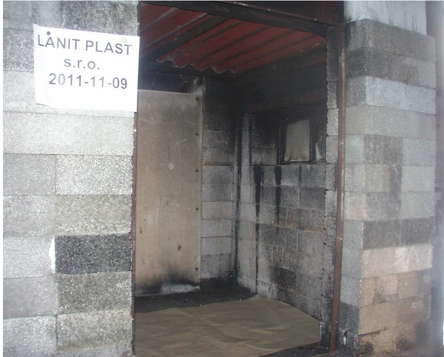
Pohled na zkušební vzorek č. 1 před zkouškou

Po instalaci zkušebního tělesa byly fotograficky zaznamenány pohledy na vzorek č. 1, prakticky identické pohledy na vzorek č. 2 nejsou uváděny: