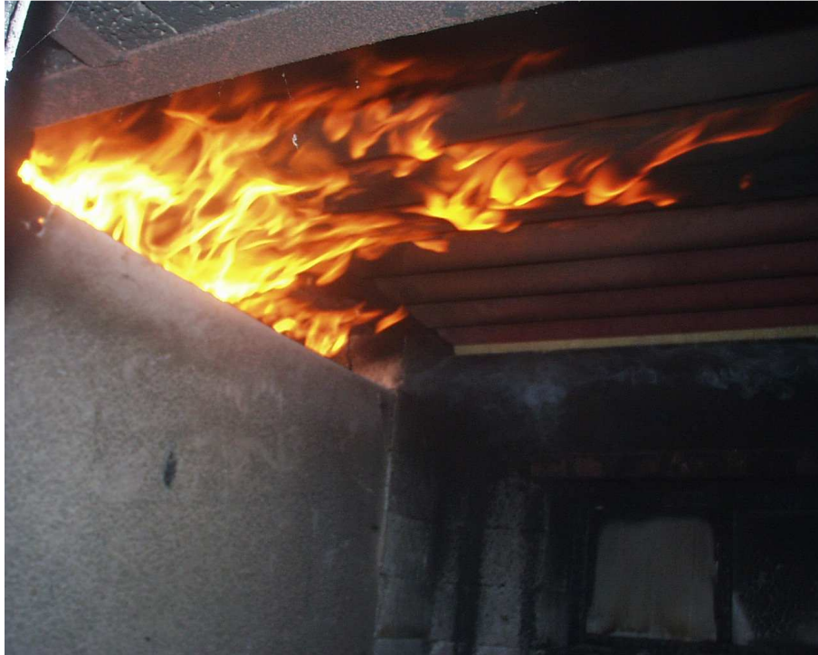
Pohled na zkušební vzorek č. 1 (8. min zkoušky)