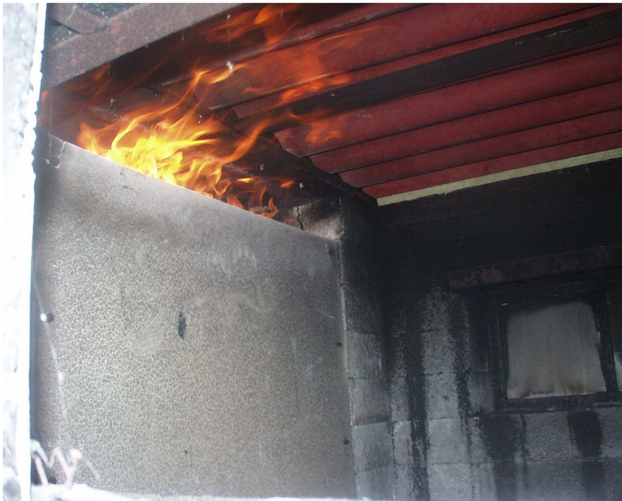
Detail zkušební vzorku č. 1 při zkoušce (3. min zkoušky)