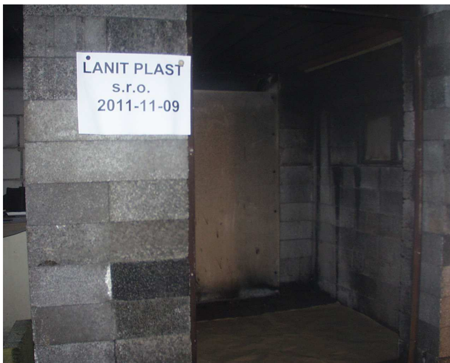
Pohled na zkušební vzorek č. 1 po zkoušce